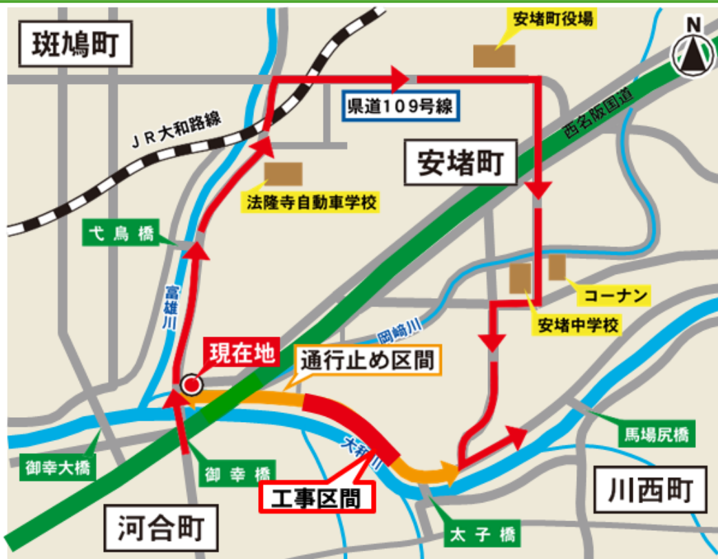
迂回路案内看板イメージ