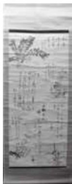
社中寄せ書き軸 (伴林光平・今村文吾他筆)