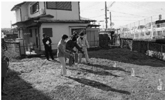
ハザードマップを用いた講習及び水消火器体験