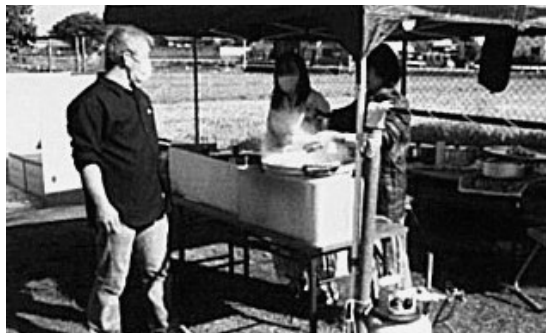
町の防災備品の展示や炊き出しの試食