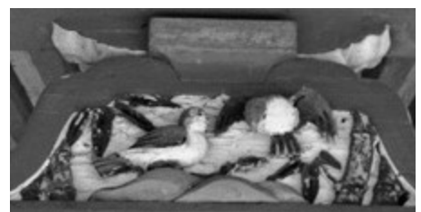
臺股の竹と雀の彫刻

神社と雀は深い関係にあったことがうかがえます。現在の竹と雀の彫刻は、『安堵村史』によれば、以前のものが破損したので、昭和28年9月に再彫刻されたものです。