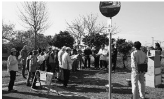
ハザードマップを用いた講習及び水消火器体験