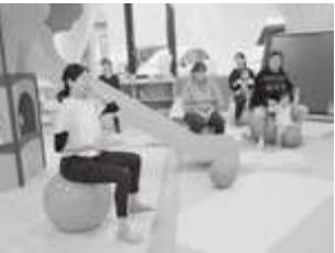
3月 バランスボールの様子