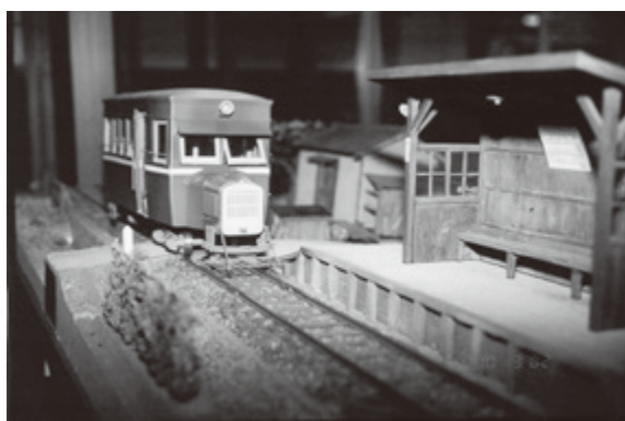
天理軽便鉄道模型