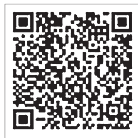
参照：二次元コード