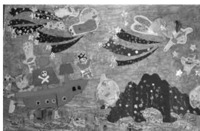
安堵こども園 青組さん 「ピーターパン」