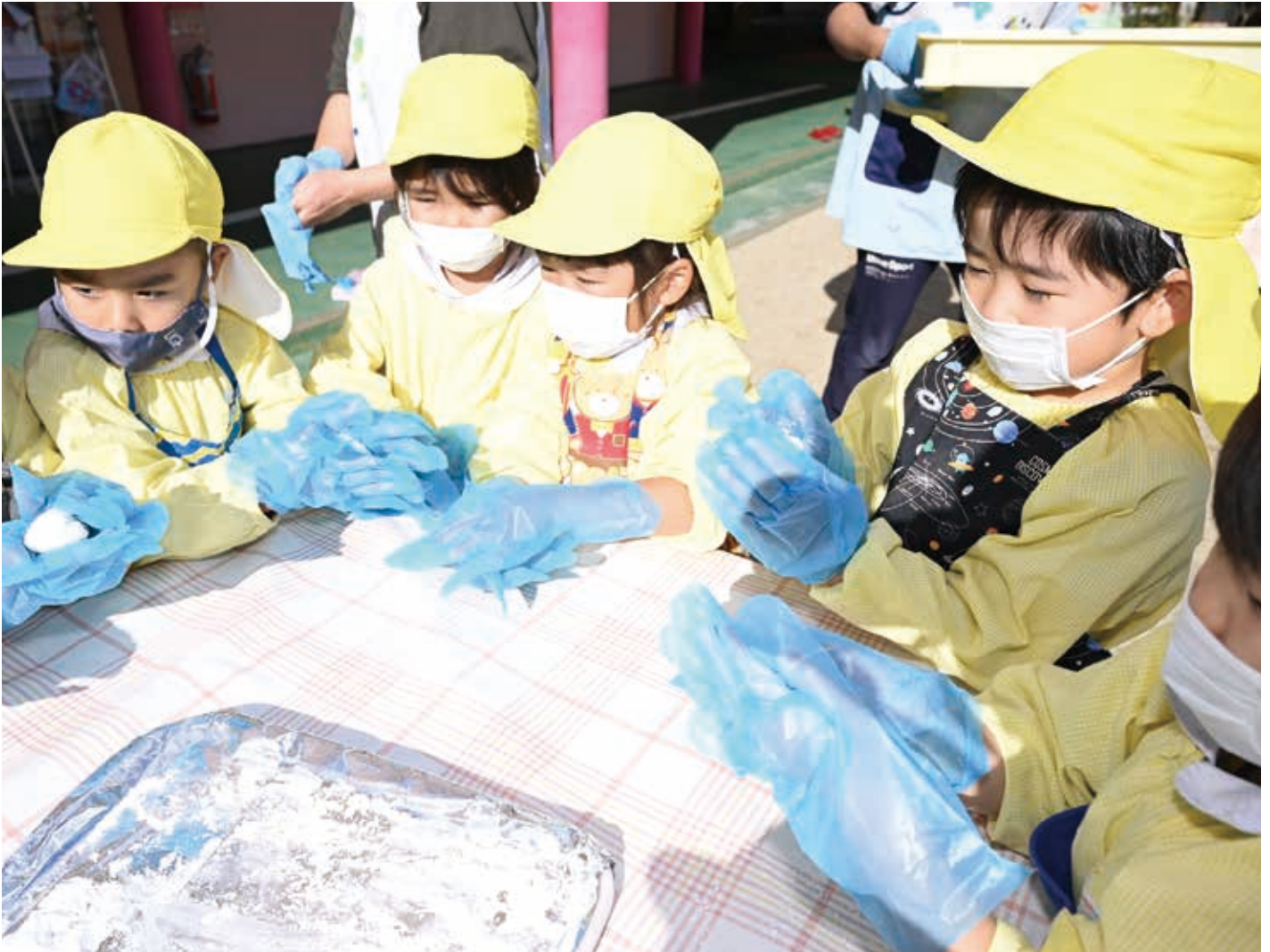
安堵こども園 餅つき大会