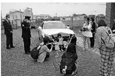
「おまわりさんによる防犯のお話し」の様子