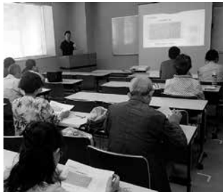
以前のセミナーの様子

※セミナー参加は予約不要です。 ※相談会には予約が必要です。 左記までご連絡ください。