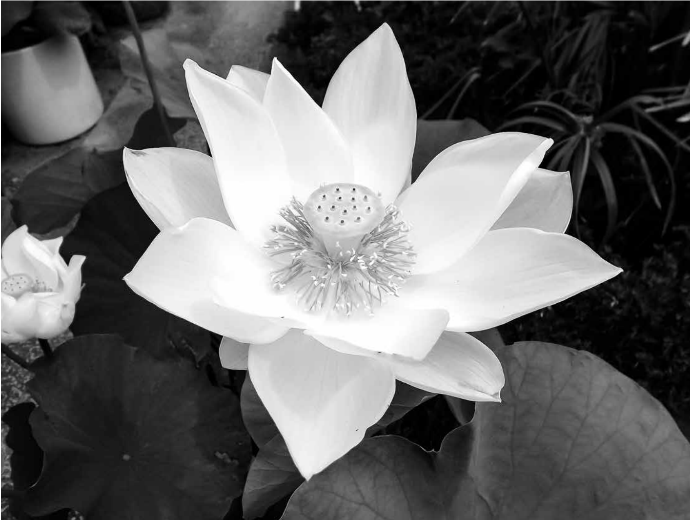
蓮の花（歴史民俗資料館）