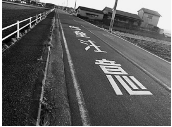
④ かしの木台 集会所付近 ・学童注意表示（道路）・止まれシールの張り替え（足元）