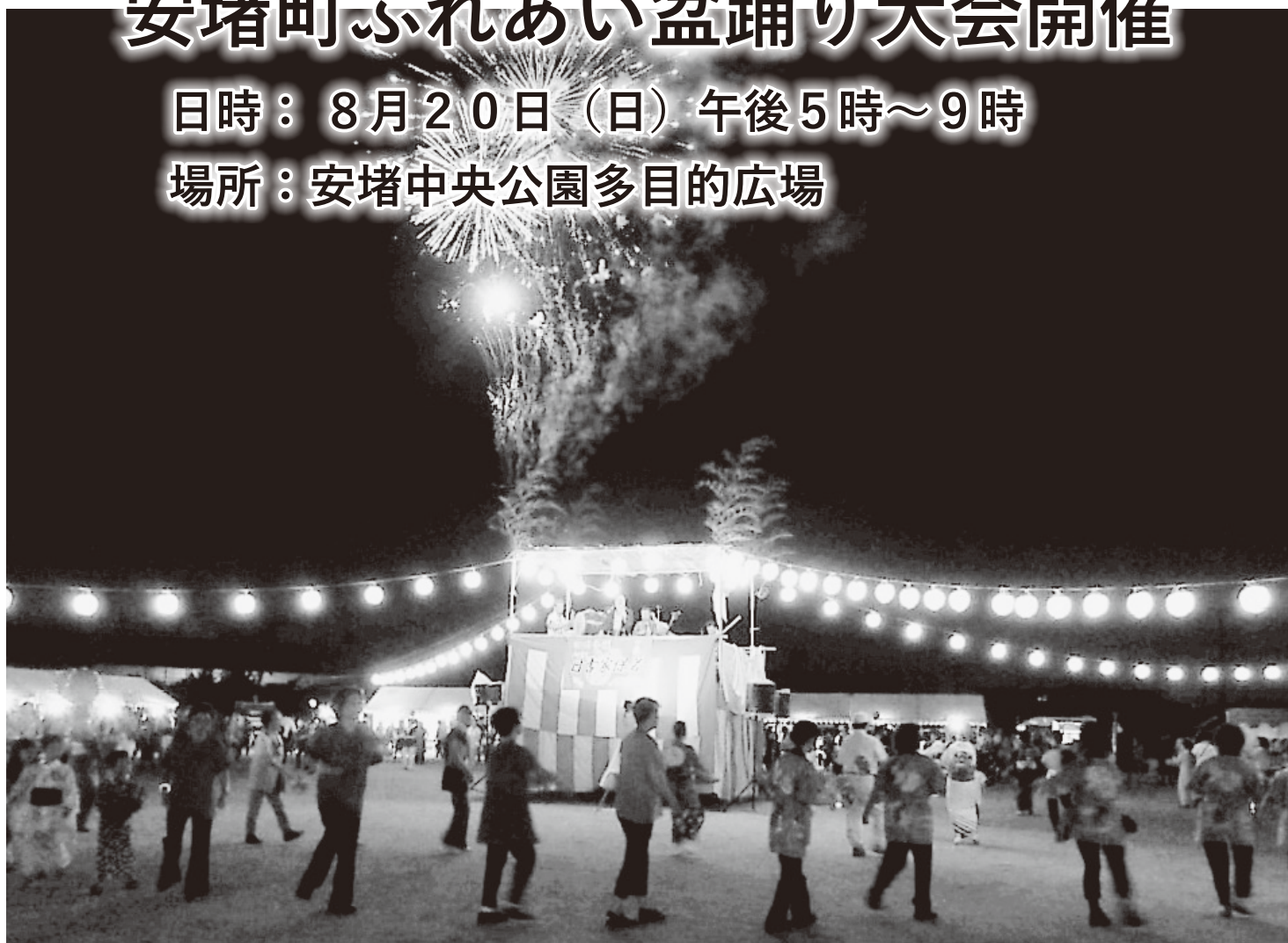
(写真は以前の様子)