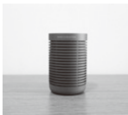
ワイヤレススピーカー