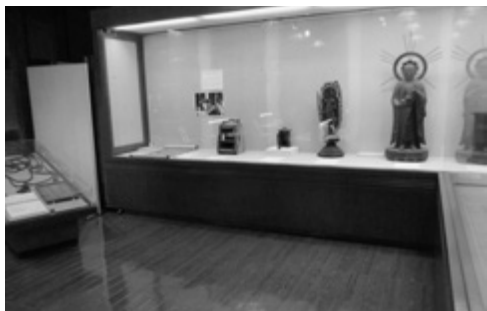
歴史民俗資料館 企画展 「平楽寺一什物と地域の営み」 (5月31日(水)まで開催)

聖徳太子開基、筒井順慶中興と伝えられる名刹平楽寺は明治七年(二八七四)に無檀無住(檀家がないう・住職がいないう)を理由に廃寺になります。寺跡には地蔵堂が残りますが、この地蔵堂も近年取り壊され、地藏菩薩立像を初めとした什物は歴史民俗資料館に寄託されました。名刹平楽寺は一四〇〇年の歴史に幕を降ろしたのです。