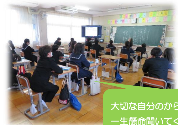
大切な自分のからだのこと、一生懸命聞いてくれています。