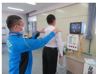
「からだ調べ」の様子

ため、安中生一人一人が自分自身をもっと知って欲しい、そして皆さんが進む先の社会をもっともっと知ってほしいと思っています。