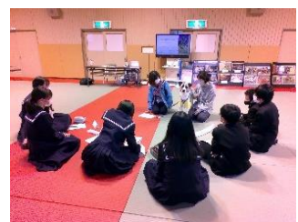
「職業講演会」の様子