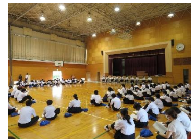
生徒総会での審議の様子

その中で決まった、今年の学校目標が「未来創造」の4文字です。コロナ禍により大きく様変わりした私たちの生活、失ったものも多いけど、下を向いてばかりはられない・・・そんな気持ちが伝わってくるスローガンとなりました。