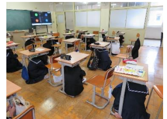
机の下に避難する生徒たち

ゴールデンウィーク明けの5月7日(金)6限目、大規模地震が起こったと想定して今年度初めての避難訓練を実施しました。 防災に関するビデオを視聴した後、Jアラートによる緊急地震速報の試験放送を利用したため、緊張感のある訓練となりました。 地震が収まり、避難指示の放送が流れてから体育館で全員の無事が確認できるまでかかった時間は2分20秒、早い遅いは別として全員が真剣に取り組んでくれていました。