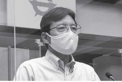
あさの 浅野の 野 勉

災害時の指定避難所(防災ハザードマップに記載)での停電発生時、発電機等が設置されていない現状であり、調査が急務。後日、議長より行政側に説明会の開催等を要請する。