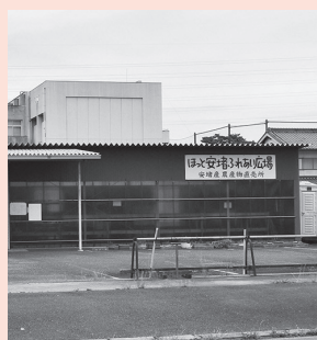
賑わい施設建設予定地だった朝市施設