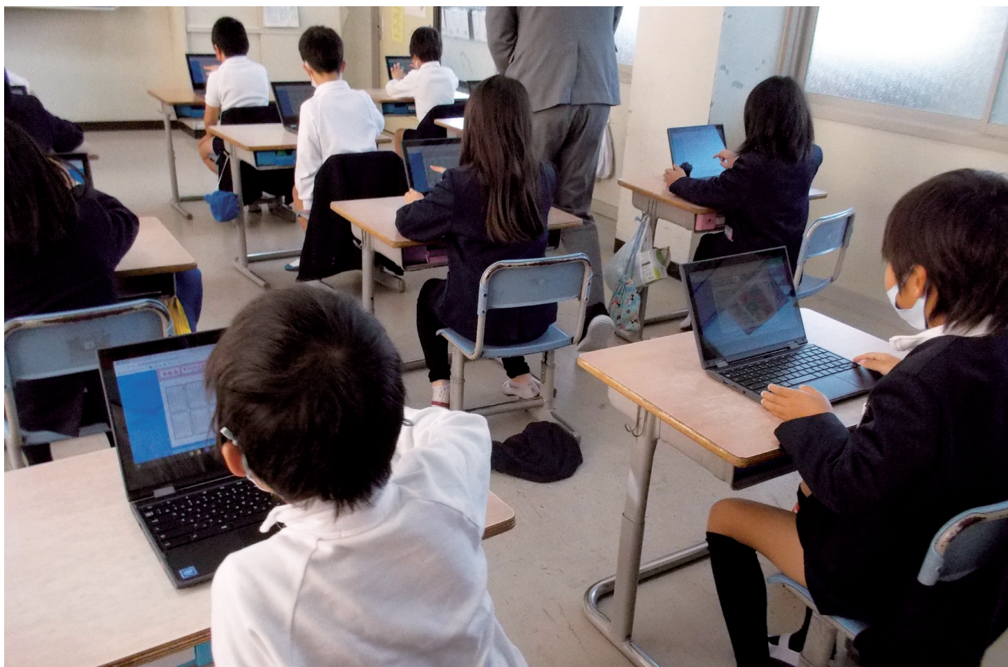
GIGAスクール構想に基づく学習風景