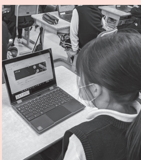
タブレット端末活用授業