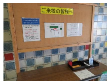
詳細は昇降口のコルクボードで

※ 受付用紙は約1ヵ月間保管させて頂き、その間感染が起こっていないことが確認されましたら、当校で処分させていただきます。