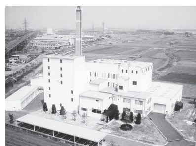
環境美化センター（焼却施設）