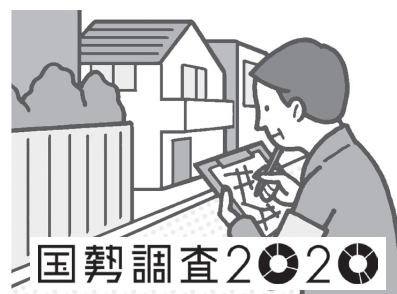
国勢調査事業（イメージ）