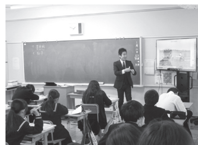
中学校授業の様子