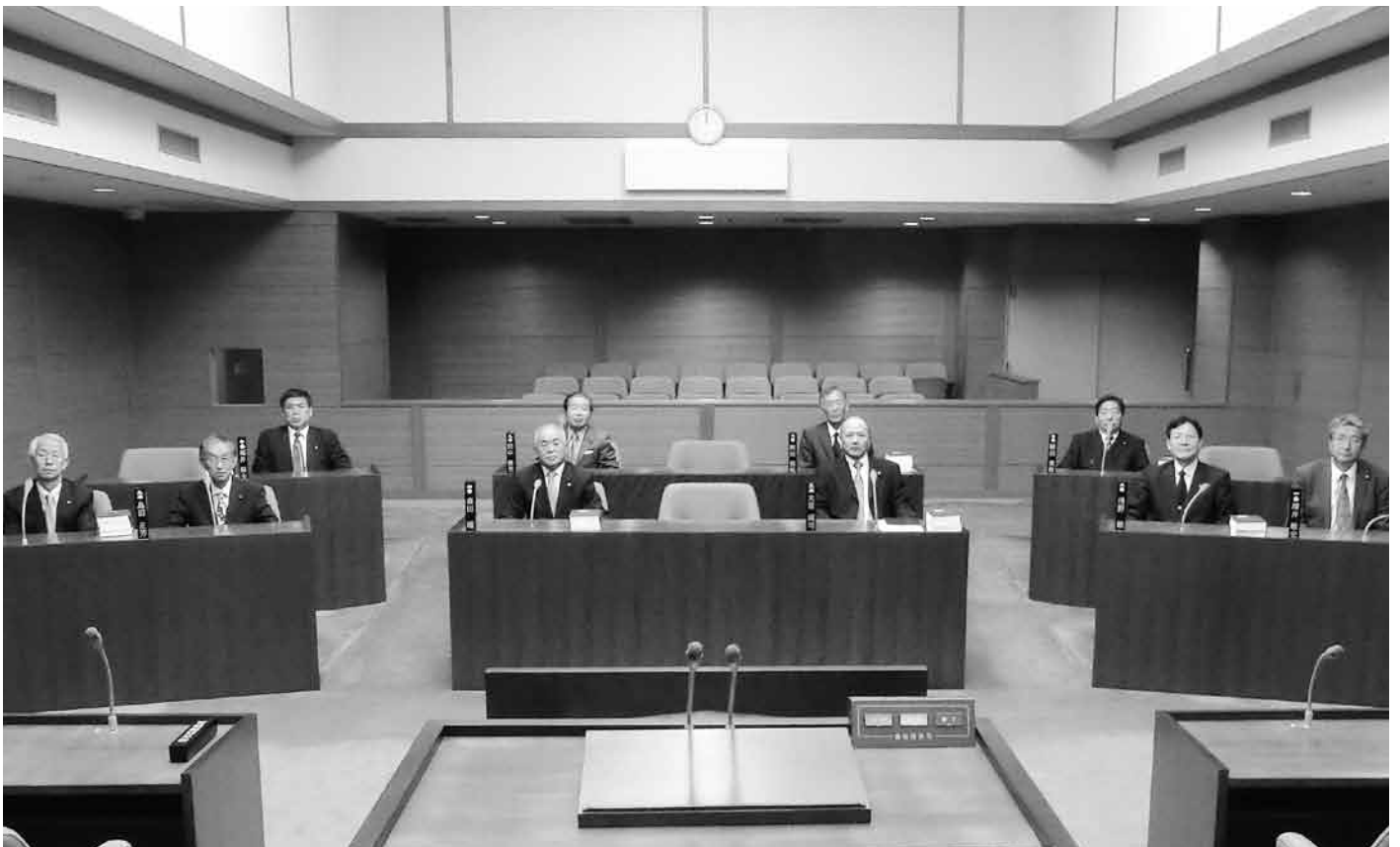
安堵町議会議場・議席