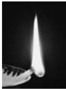
灯芯の燃える様子

江戸時代より続く安堵町の伝統技術「灯芯ひき」を体験してみませんか。今ではほとんど目にする事が出来ない貴重な体験ができます。