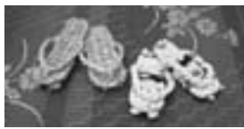
わらぞうりと布ぞうり