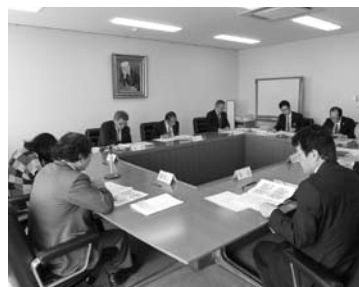
文教厚生委員協議会

提出された報告書の内容等について報告を受け協議しました。また、住民課から乳幼児医療費について現況と今後の課題について説明を受けました。