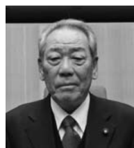
山岡 敏 議員