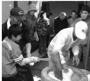
親子もちつき大会