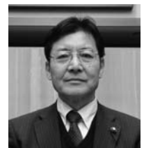
浅野 勉 議員