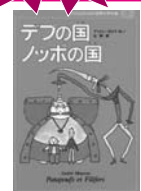
テフの国ノッポの国