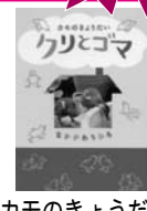
カモのきょうだい クリとゴマ