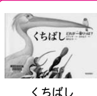
くちばし -どれが一番りっぱ?-