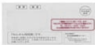
3月までの青色の封筒

ご家族の方などに「ねんきん特別便」が届いたら、過去の職歴についてご一緒に記憶をたどってみるなど、多くの方からご回答をいただけるよう、ご協力をお願いいたします。（ご家族でも、お一人お一人に届く時期は異なります。）