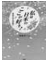
私は日本のここが好き!