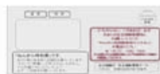
4月から10月の緑色の封筒