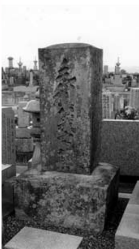
墓碑表面(窪田・阿土墓地)

四貫匁とは、江戸時代に流通していた銀の通貨単位で、西日本は日常これを用いていました。この年の平均米相場、一石(約一五〇キログラム)が銀一四九・八匁とみれば、約四トンの米を入手する額ということになります。当時一日五合(七五〇グラム)を消費したとすると、五三〇〇食以上の兵糧に相当する巨額な借財だったこととなります。