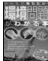
環境問題がわかる本