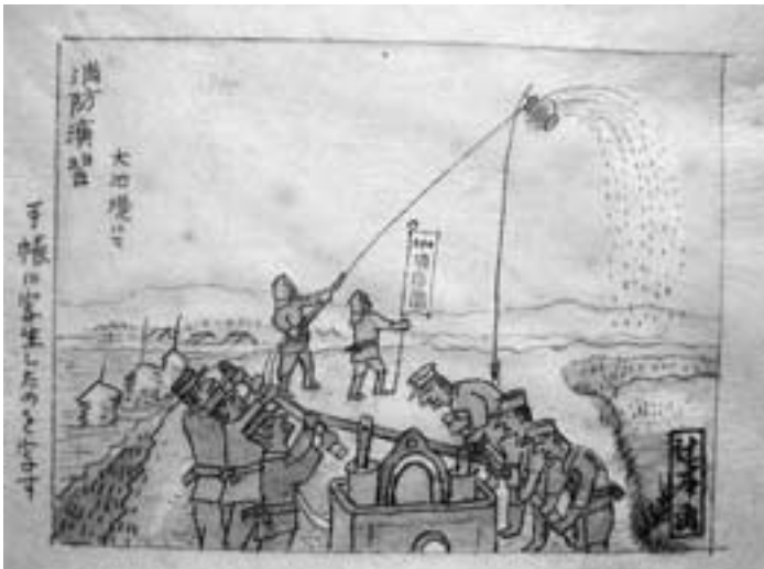
(消防演習 西安堵大池堤にて)