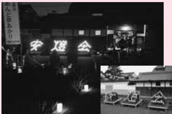
あんど夢あかり“安燈会”テスト点灯 (安堵町歴史民俗資料館前)