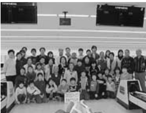
家族ボウリング体験会