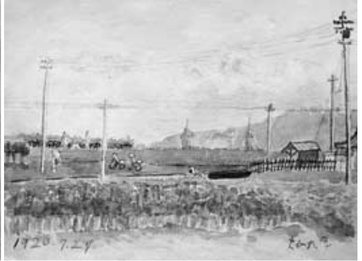
(下池の堤と右手に旧軽便鉄道あんど駅、遠望に若草山と春日山)