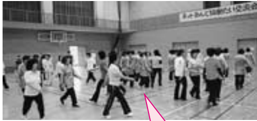
昨年の様子。出会いあり、笑いあり！体を動かすゲーム等で親睦を深めました。

内容 「お互いの活動を認め合い、しっかりと手をつなぎましょう」をテーマに活力あるまちづくり、健康づくりを推進し、町民の皆様との親睦と健康を願い、歌、おどり、体操、寸劇、ゲーム、太極拳など全員参加型交流会です。