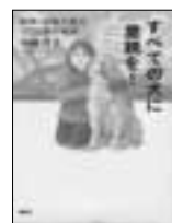
すべての犬に里親を