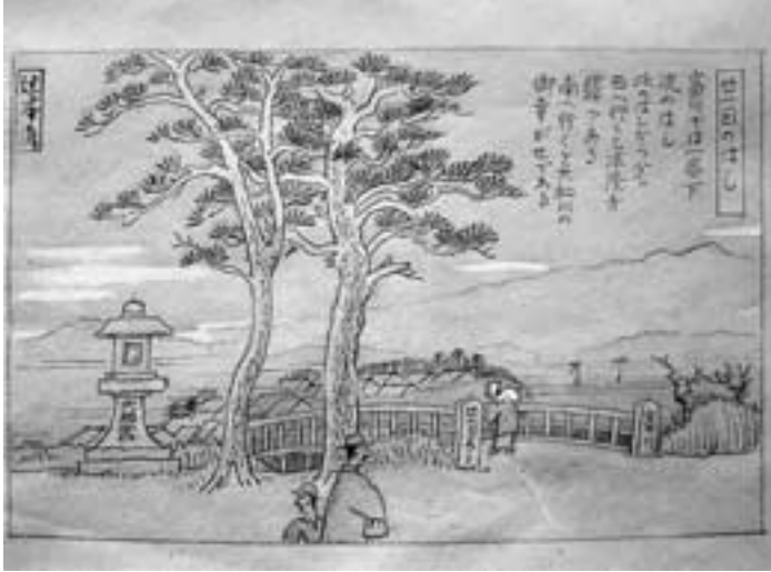
(笠目の戈橋、渡れば法隆寺駅方面)