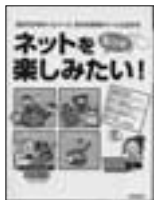
ネットをもっと楽しみたい