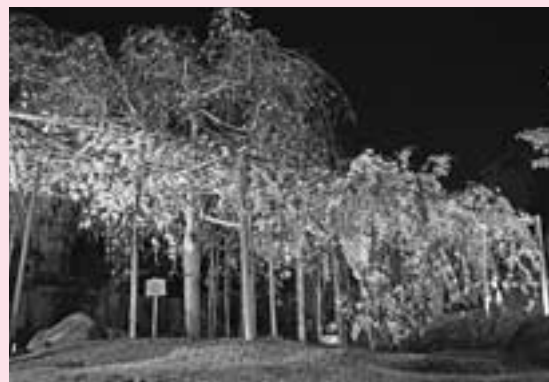
しだれ桜“勤三桜”のライトアップ (安堵町歴史民俗資料館)