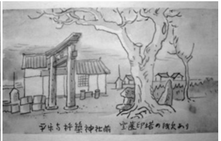
下窪田杵築神社前広場