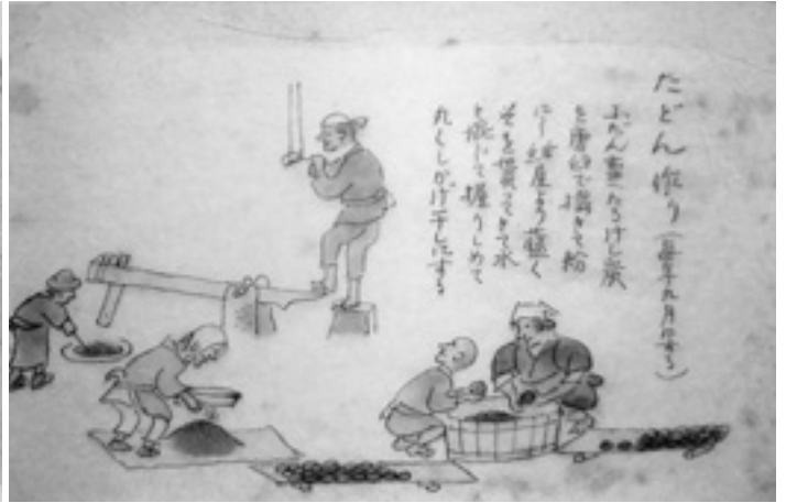
冬の準備始まる「こたつ」に入れるたどん作り