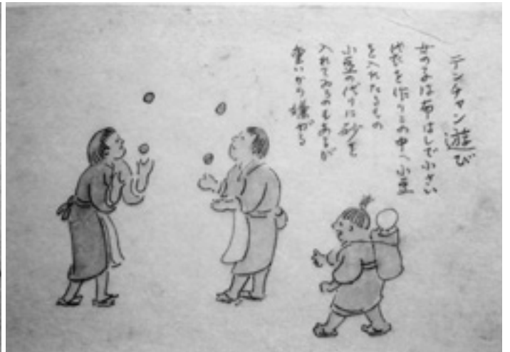
テンチャン遊び、他にはなわとび、糸とり 女の子は良く遊ぶ —辻本奨之氏所蔵 辻本忠夫氏スケッチ画より—