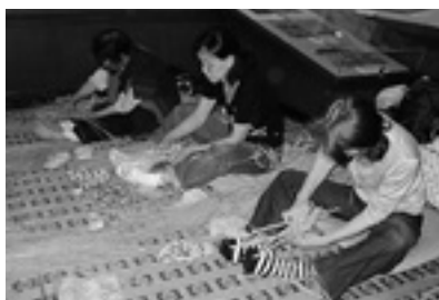
わらぞうり作り風景

■ゴールデンウィーク 休館のご案内■ 5月4日(火)は開館。 5月6日(木)が振替休館日 となります。