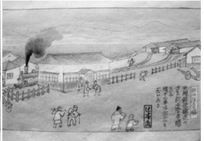
天理軽便鉄道の新法隆寺駅