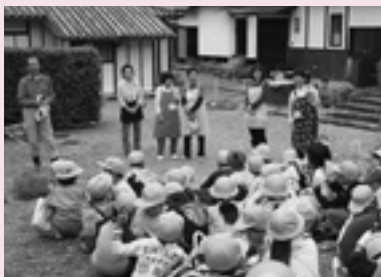
中家見学・笥掘り (小3) 「郷土学習」