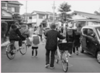
登下校の見守り (小) 「安全確保」

「宍塚ワクワク学校支援本部事業」として、学校支援ボランティアがあります。小中学校において、多くのボランティアの方々に参加、協力していただいています。