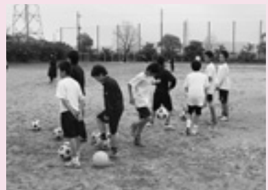
サッカーの指導 (中) 「クラブ活動支援」