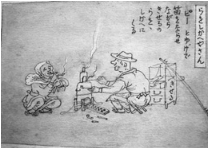
たばこのらをしかえ屋さん 村から村へ