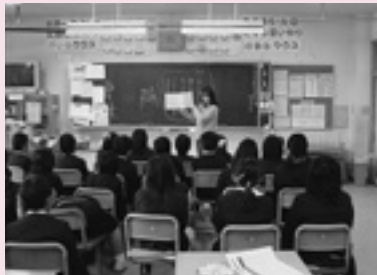
朝のおはなし配達・朗読 (小中) 「読書活動」