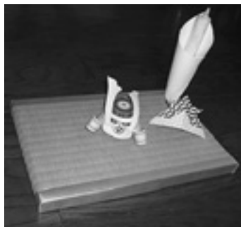
今回製作するミニ畳