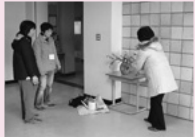
生け花の展示 (中) 「環境美化」