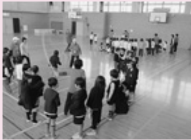
いきいき子どもクラブ (小1) 「運動普及」