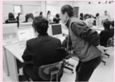
授業の支援 (中) 「パソコン学習支援」