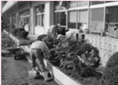
草木の剪定 (小中) 「環境整備」