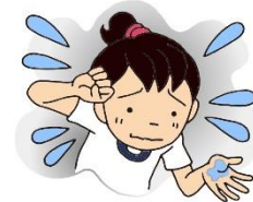
汗はまったくかかない、 または汗がひどい