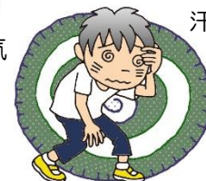
めまいや立ちくらみ