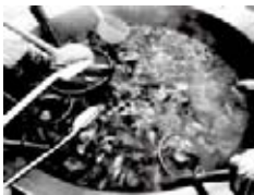
大和牛と安堵町産の野菜 をたっぷり!!

1月26日（土）・27日（日）平城宮跡の朱雀門前ひろばにおいて、奈良の伝統と歴史、講話や体験、おいしいものにおみやげものが一堂に集まる「奈良大立山まつり2019 奈良ちとせ祝ぐ寿ぐまつり」が開催されました。