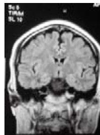
32歳男性 適量飲酒者