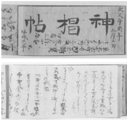
伴林光平書 『神相帖』