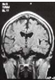
30歳男性 アルコール多量飲酒者