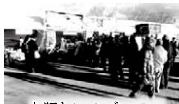
大賑わいのブース