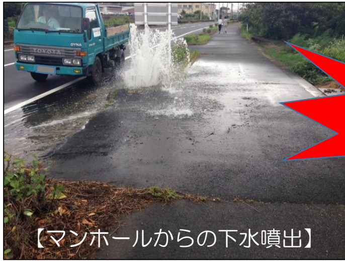
【マンホールからの下水噴出】

【原因】 雨水を流す雨樋などの排水が、「污水管」につながれていることや雨天時に汚水ますの蓋を開けて宅内の雨水を排水していること等が原因です。