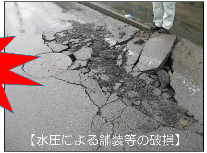
【水圧による舗装等の破損】