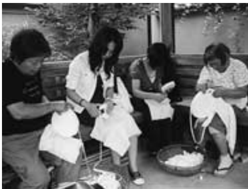
昨年のかんぴょう作り