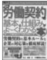
労働契約の基本と仕組み