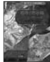
デモナータ6 悪魔の黙示録