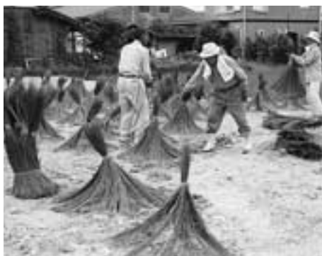
昨年のい草の乾燥風景