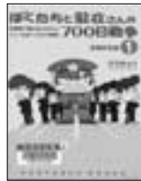
ぼくたちと駐在さんの700日戦争