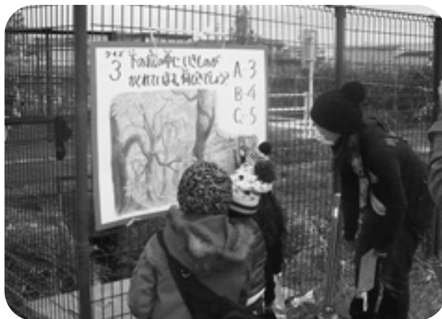
子どもコーナー風景