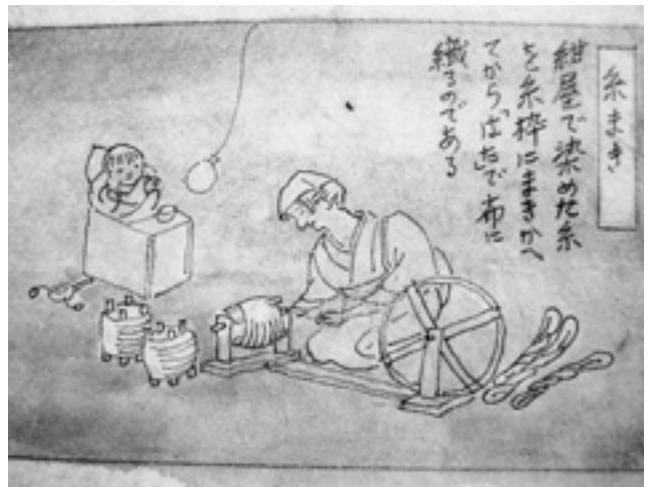
昔は各家で糸まきが行われた。