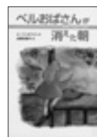
ベルおばさんが消えた日