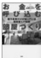
お金を呼び込む部屋づくり