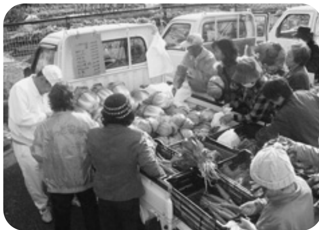
新鮮野菜市場風景