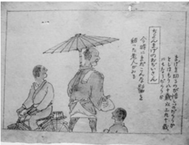
ちょんまげのおじいさん