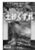
世界の災害の今を知る(土砂崩れ)