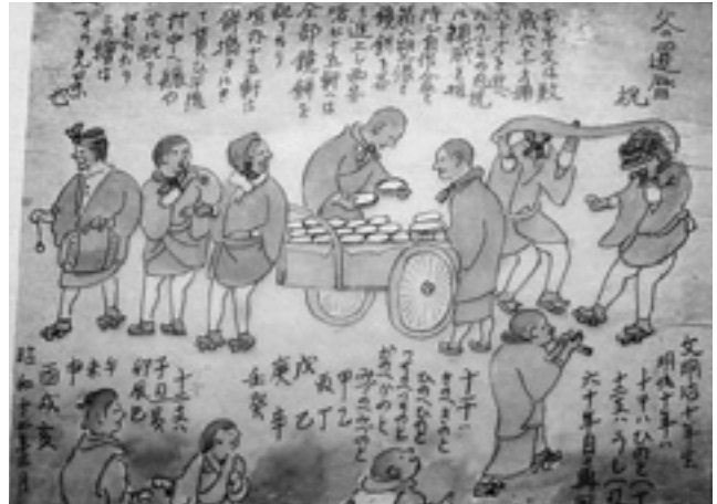
盛大な還曆祝(村中鏡餅配る)