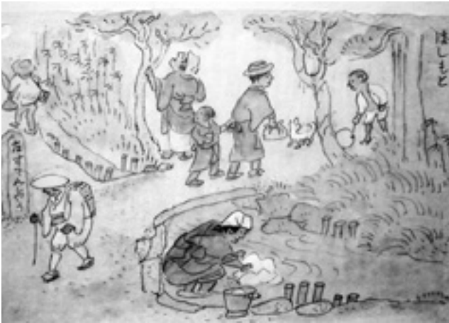
西安堵 1号垣内の交差点(はしもと)