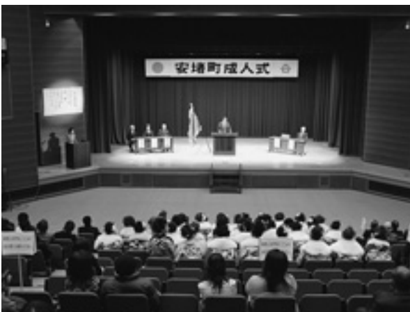
平成21年成人式の様子