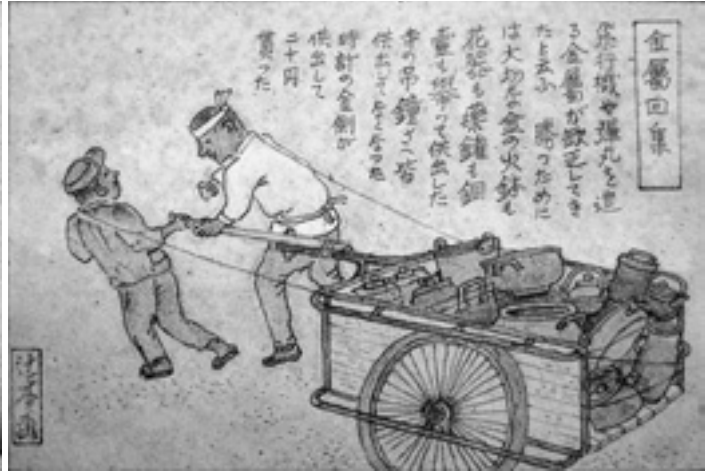
金属回集 (共出命令始まる)