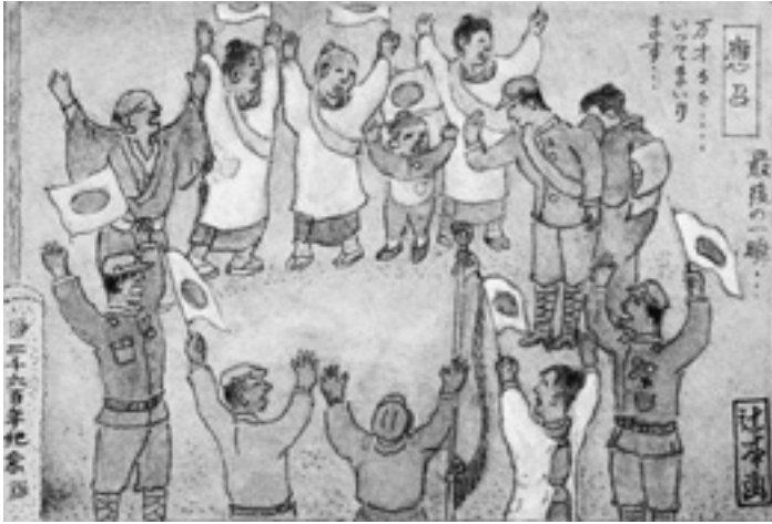
召集命令 (村はずれで見送る)