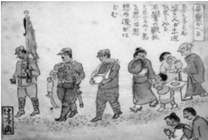
英霊かへる (名誉の戦死)