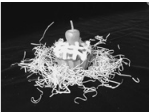
スイーツキャンドル

カラフルな色合いと、本物そっくりな見た目に、美味しそうに思わず食べてしまいそうなスイーツキャンドル。今回は、今人気のスイーツキャンドルを手作ります。