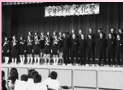
透き通った女声と力強い男声が絡み合う合唱コンクールの舞台発表

自分の将来や生き方のよりどころとなる作品に出会った感動や決意が表現されていました。校舎内では、各教科の学習課題の展示や部活動の作品の展示発表が行われました。午後からは「古典落語」の鑑賞会がありました。