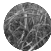
▲左から 緑もち・紅染糯・神丹穂